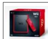
Wii - Console Mini, Red

I Giovani Imprenditori della Campania incontrano i parlamentari